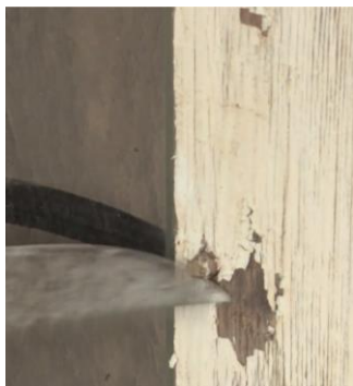
Eksempler på tydelige historiske spor (fotos fra filmen)